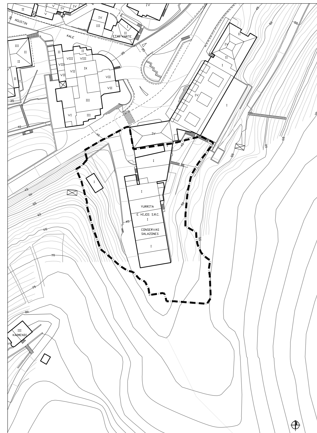
EGUNGO EGOERA. ESTADO ACTUAL.