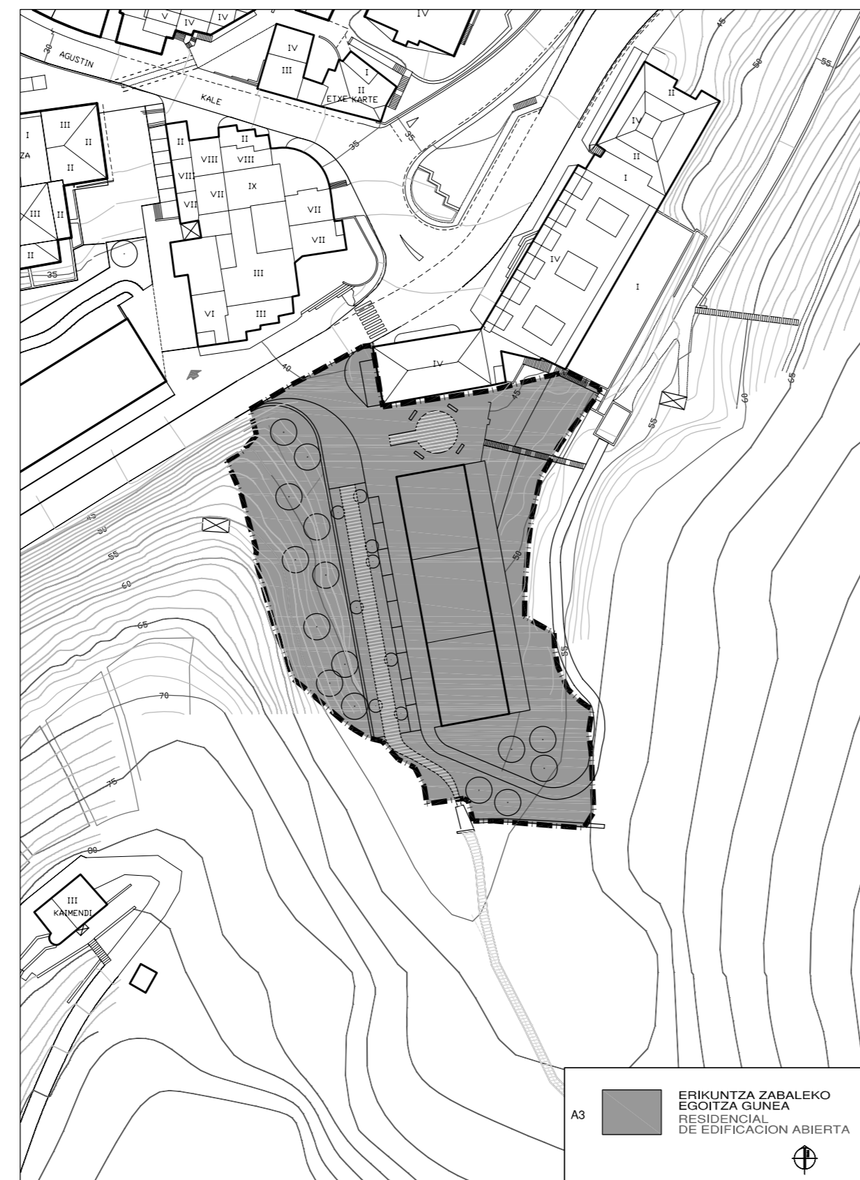
KALIFIKAZIO GLOBALA. CALIFICACION GLOBAL.