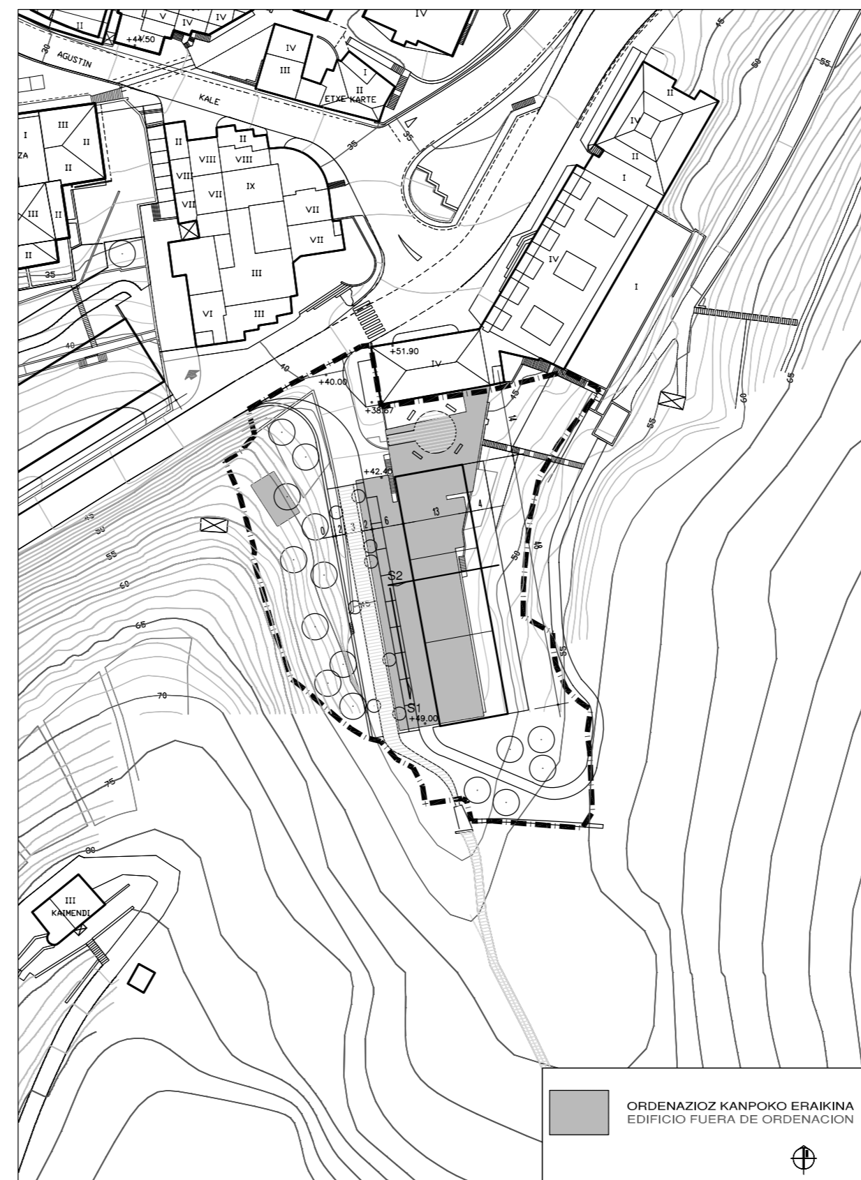
ANTOLAKUNTZA / EGUNGO EGOERAREN GAINJANTZIA. SUPERPOSICION ORDENACION / ESTADO ACTUAL.