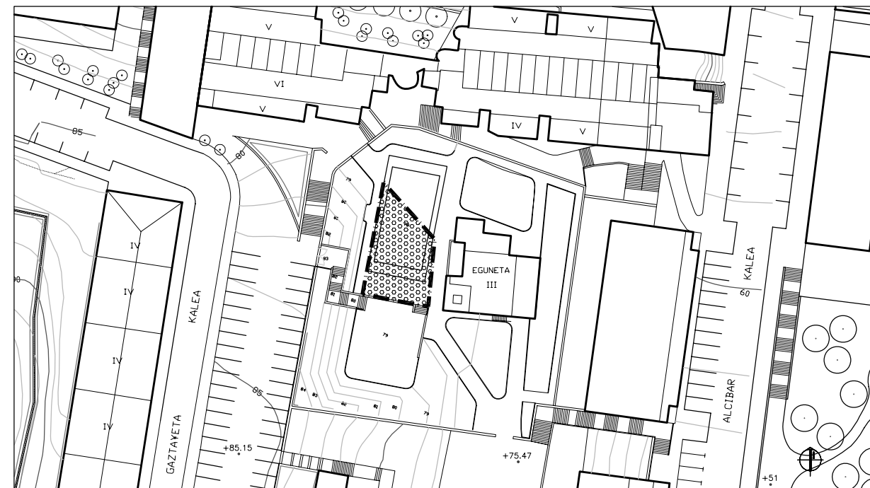
ANTOLAKUNTZA XEHATUA. ORDENACION PORMENORIZADA.