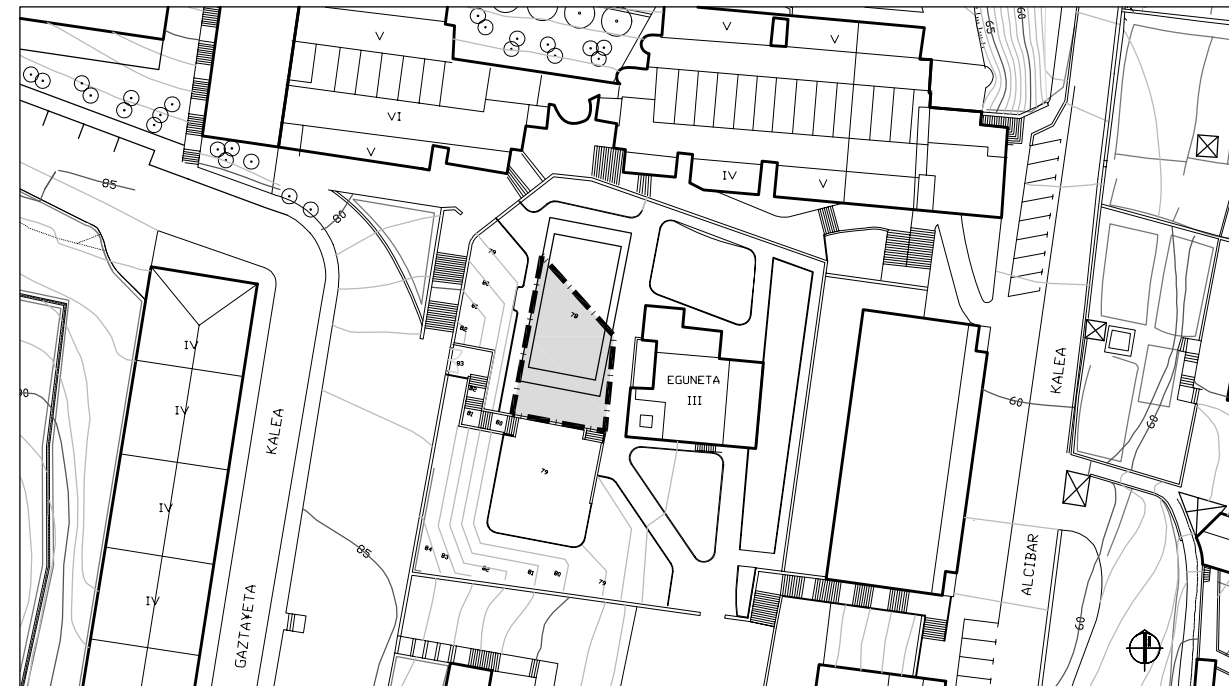
EGUNGO EGOERA. ESTADO ACTUAL.