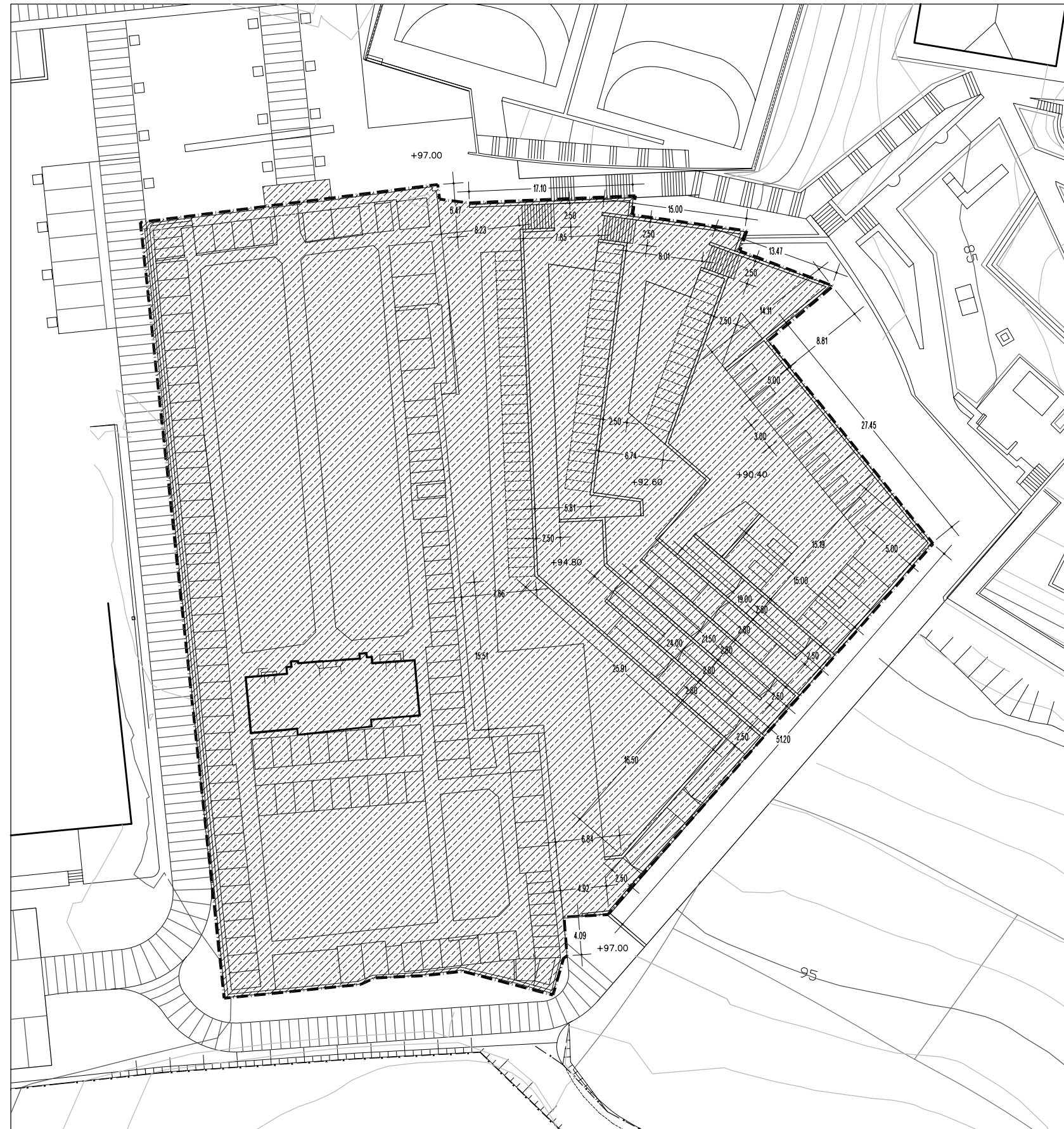
PLANTA ESCALA 1/500 Cotas en m.