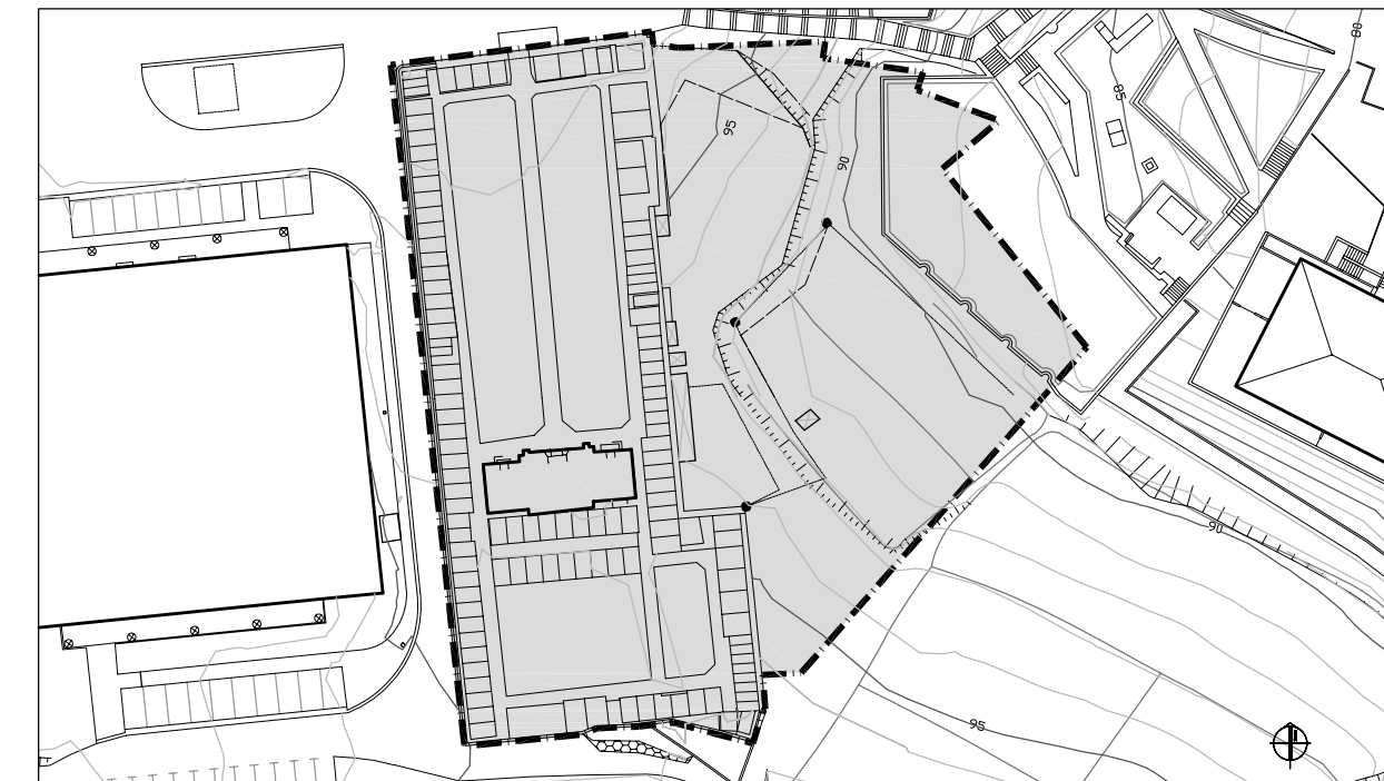
EGUNGO EGOERA. ESTADO ACTUAL.

ZUZEN GAUZATZEKO UNITATEA UNIDAD DE ACTUACION DIRECTA SUPERFICIE: 5.036 m 2 ko AZALERA